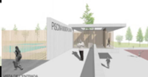
VISTA DE L'ENTRADA