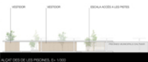
ALÇAT DES DE LES PISCINES, E= 1/1000