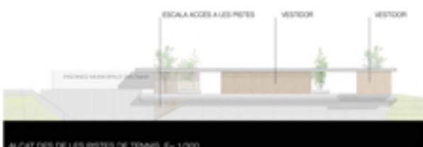
ALÇAT DES DE LES PISTES DE TENNIS, E= 1/1000