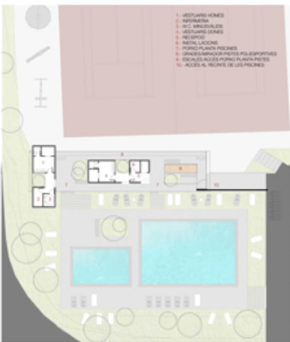
PLANTA VESTUARIS, E= 1/1000