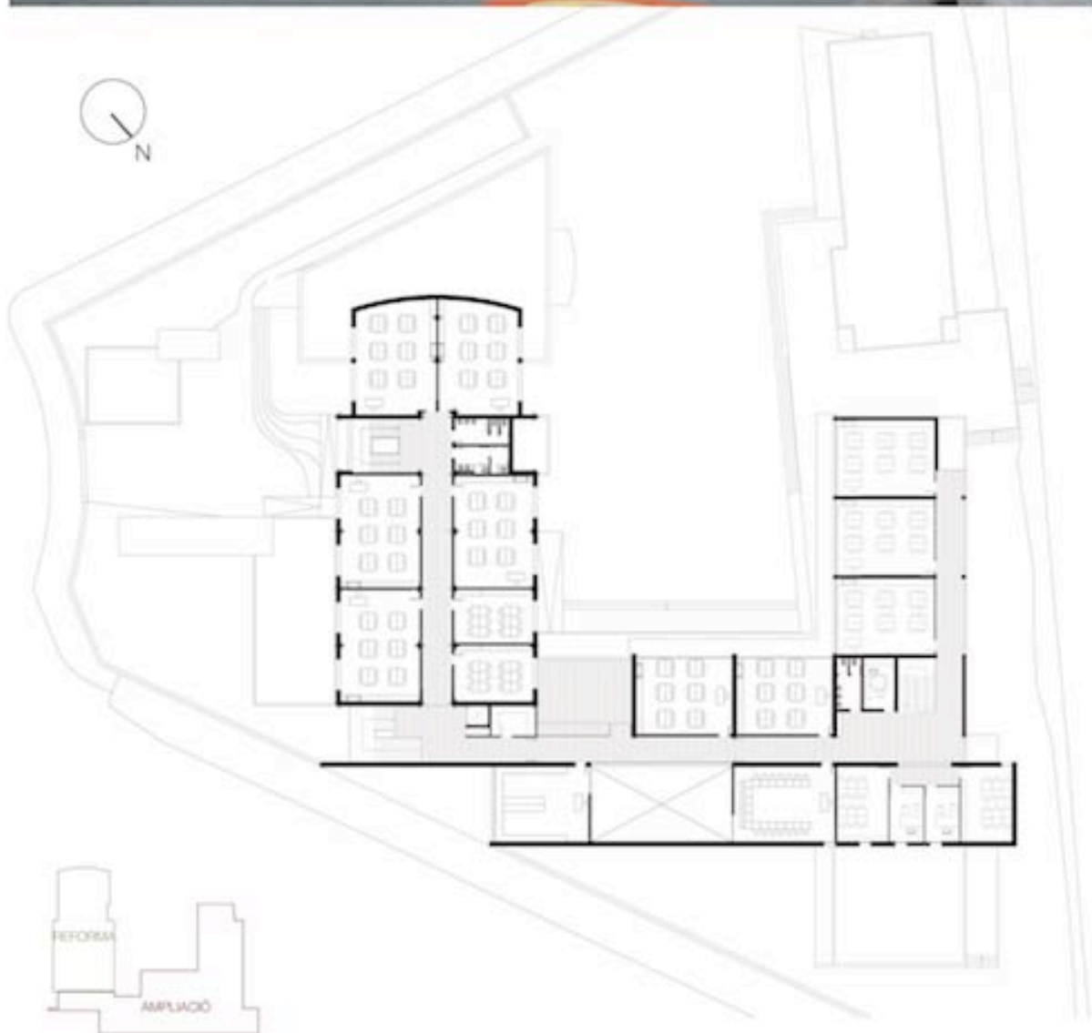
Planta Primera E: 1/500