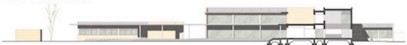
secció transversal pel vestíbul d'accés E: 1/500